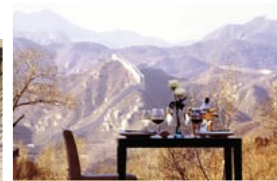
Los miradores de Commune by the Great Wall regalan postales del paisaje atravesado por el muro.